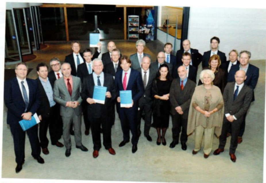
Overhandiging Nationale Innovatie Agenda Veiligheid

Het Ministerie van Veiligheid en Justitie is samen met het Ministerie van Economische Zaken officieel contactpunt voor de Europese Commissie voor het thema secure societies . Zij inventariseren wensen en verwachtingen bij overheid, bedrijfsleven en kennisinstellingen en agenderen deze in Brussel. Vervolgens kunnen Nederlandse onderzoekers en ondernemers hierop inschrijven, de Rijksdienst voor Ondernemend Nederland ondersteunt het vormen van consortia en indienen van plannen, en monitort de voortgang van lopende projecten. Daarnaast zijn er via de Rijksdienst voor ondernemend Nederland diverse andere subsidiemogelijkheden van Europese en Nationale fondsen, met name voor de fase 'van innovatie naar markt'.