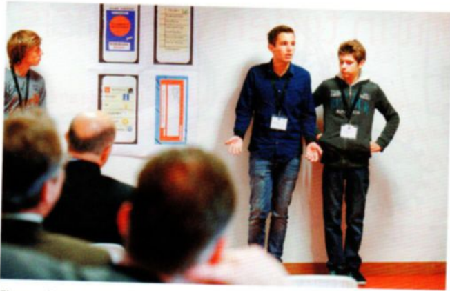
Fireguard jongeren