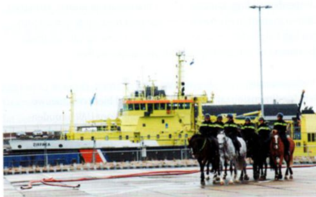
Politie te paard met helmcamera's (situation awareness)

Ongeveer 700 mensen verzamelden zich op 27 november aan het Zuiderstrand Theater in Scheveningen voor de start van het nieuwe innovatiebeleid van het Ministerie van Veiligheid en Justitie. Samenwerking met bedrijven en kennisinstellingen stond centraal bij de opzet van deze dag, die als startschot gezien moet worden voor het verder uitbouwen van de innovatie functie van het