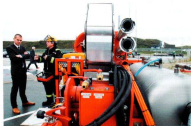
Buitendemonstratie blusrobot

departement. Zo heeft het ministerie nu ook een eigen innovatie agenda, met een opsomming van een aantal 'oplossingsvrije problemen'. Met deze vraagstukken wil het ministerie anderen van harte uitnodigen om mee te denken over innovatieve oplossingen. Hoe bijvoorbeeld te handelen als slimme apparaten domme dingen doen? En hoe ziet de digitale rechtspraak van de toekomst er uit? En hoe maken big data Nederland veiliger?